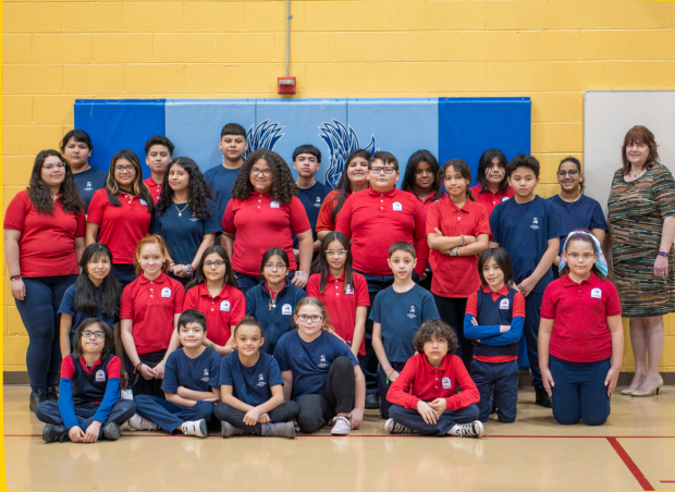
Los participantes de La Causa Charter School Cantos de las Americas