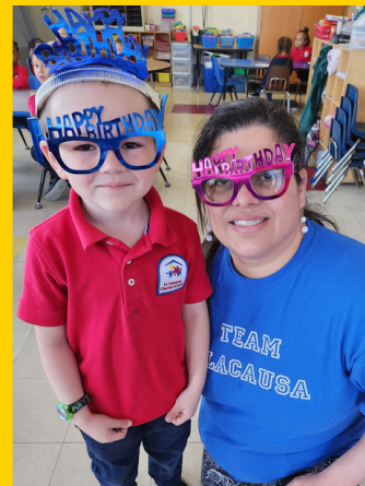
Celebraciones de cumpleaños

¡No olvides seguirnos en las redes sociales!