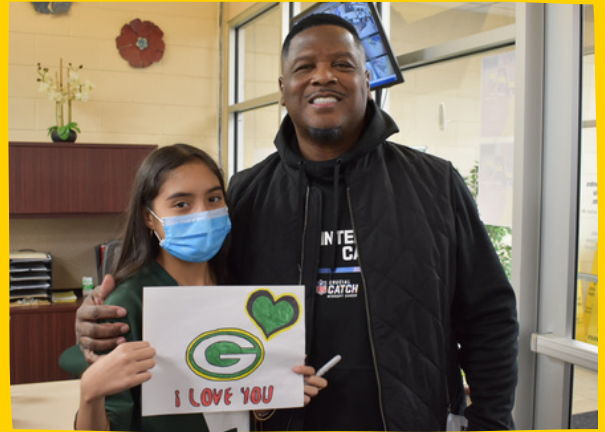
LeRoy Butler, jugador legendario de los Green Bay Packers, visito LCCS