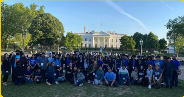
Paseo de 8vo grado a Washington DC