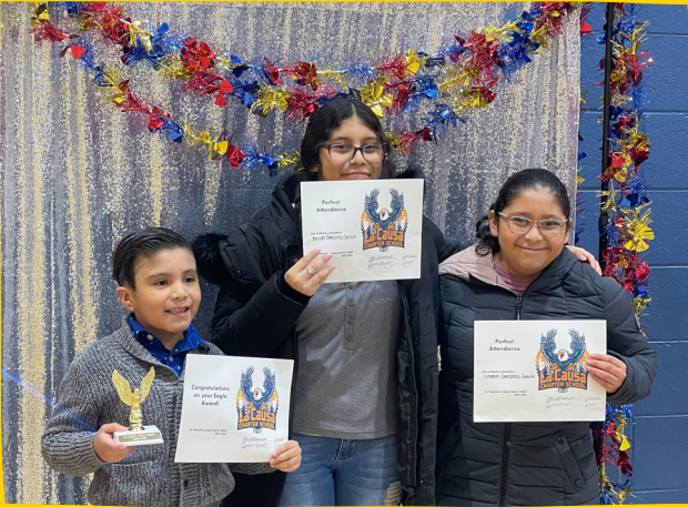
Celebración de Eagle Awards