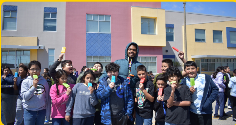
Día del niño