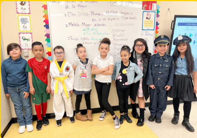
Semana del espíritu escolar