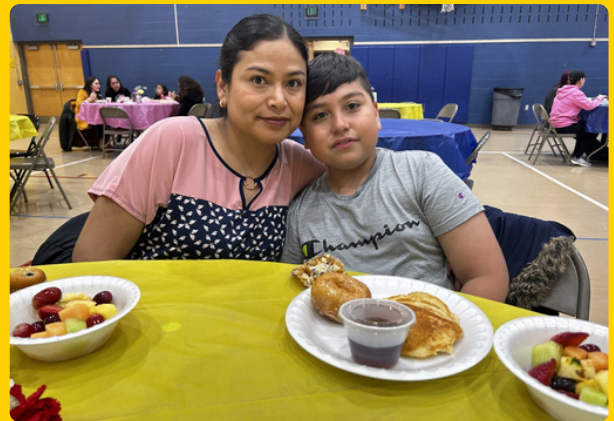
Desayuno Día de la Madre